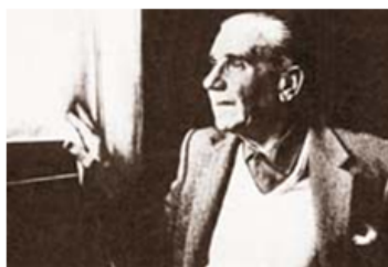
En el colegio, Tuñón leyó una frase del franciscano Roger Bacon que cambió su vida: “Contempla el mundo”.