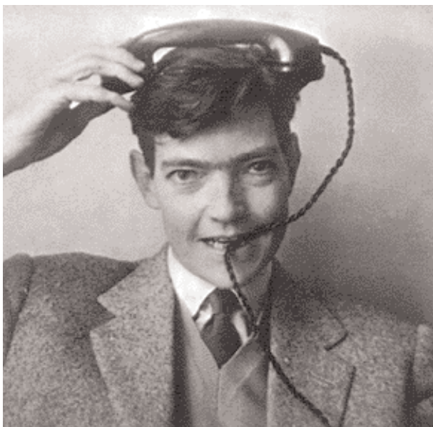
Los tiempos de Rayuela , 1958 o 59