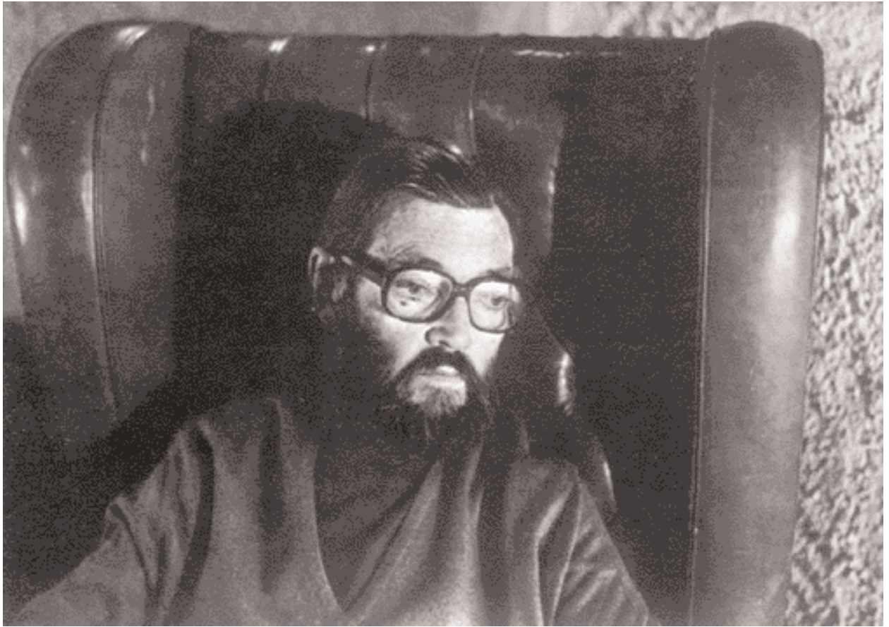
Molino del Salado, Segovia, 1983

vez encontró entre esas pertenencias un ejemplar manoseado de Rayuela . Y años después Salman Rushdie en La sonrisa del jaguar , el relato de su visita a Nicaragua en el año de 1986, habla de su sorpresa porque en los mercados de Managua, el nombre de Cortázar, el autor de “la diabólicamente esotérica y complicada Rayuela ” hubiera llegado a ser popular entre las gordas mujeres de delantal que servían la comida en las largas mesas comunales. Allí comió Cortázar alguna vez.